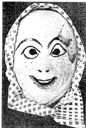
Die Maske der Weil- heimer Rossmugga

„Und wer in Weilheim Sommer- sprossen hatte, dem wurde ge- raten, sich an den vier Freitagen im Mai mit dem Tau auf dem Gras zu waschen, dann würden sie verschwinden“.